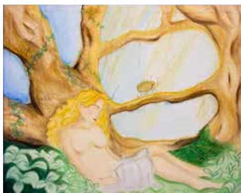
Ausstellung der Schülerinnen der 7Ma Profilklassse Gestalten des Liechtensteinischen Gymnasiums.