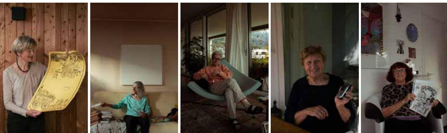
Fotoarbeit von Beatriz Sprenger

Ausgewählte Gegenstände der ehemaligen Dornröschen: Plakat, Quadratschädelflugblatt, Film und Rasierapparat, der ans Postfach gesandt wurde.